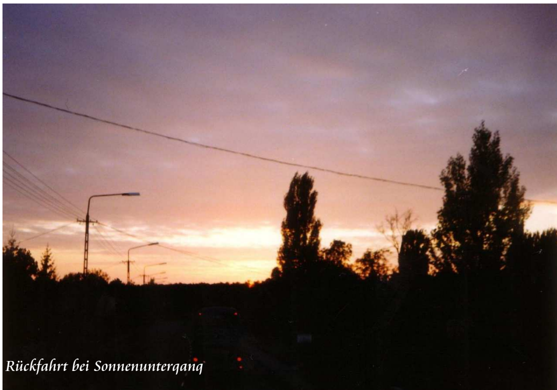
Rückfahrt bei Sonnenuntergang